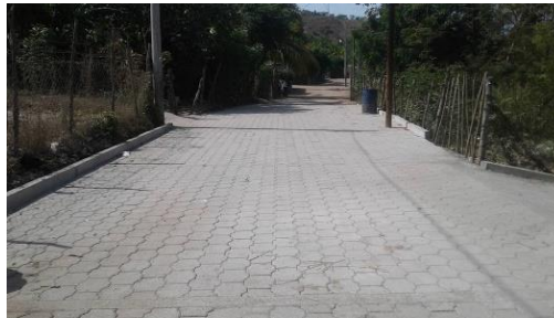
MEJORAMIENTO CALLE HACIA LA COLONIA, ALDEA LAS OVEJAS