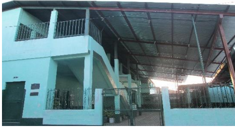
MEJORAMIENTO ESCUELA PRIMARIA LUCILA PERALTA, CABECERA MUNICIPAL