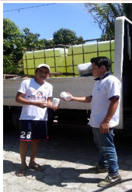
ABASTECIMIENTO DEL CLORO DE LAS DIFERENTES ALDEAS DEL MUNICIPIO