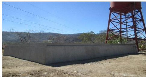
MEJORAMIENTO SISTEMA DE AGUA POTABLE ALDEA EL PASO DE LOS JALAPAS