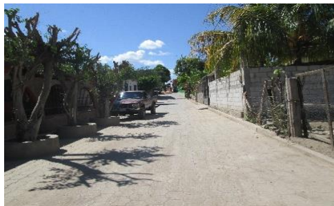
MEJORAMIENTO CALLE BARRIO VISTA BELLA, CABECERA MUNICIPAL