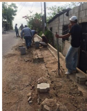
INSTALACION DEL RAMAL NUEVO EN ALDEA ESPIRITU SANTO PARTE DE ARRIBA