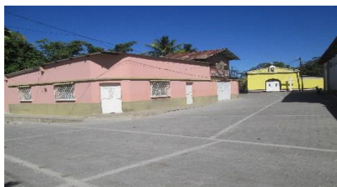
MEJORAMIENTO CALLE FRENTE AL PARQUE, ALDEA LAS OVEJAS