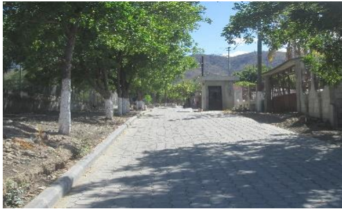
MEJORAMIENTO CALLE HACIA INSTITUTO BASICO, ALDEA LAS OVEJAS