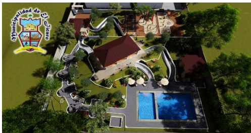
MEJORAMIENTO PARQUE DEPORTIVO Y RECREATIVO, CABECERA MUNICIPAL