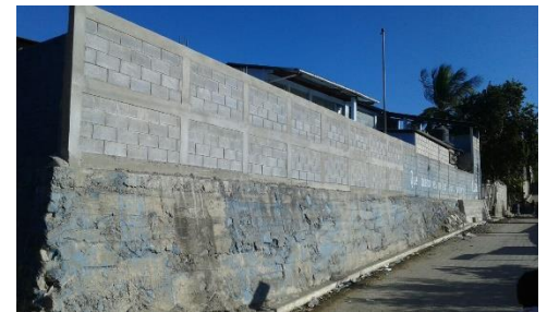
MEJORAMIENTO ESCUELA PRIMARIA (9 EDIFICIOS PUBLICOS ESCOLARES RURALES)