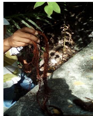
LIMPIEZA DE LOS CAUDALES DEL AGUA QUE CONDUCE DE LA MONTAÑA