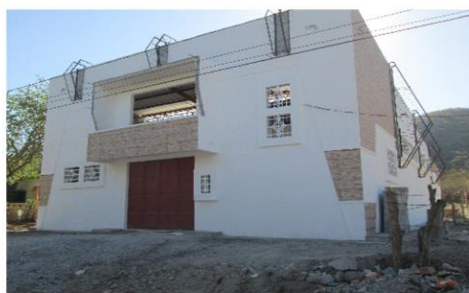
CONSTRUCCION SALON COMUNAL, ALDEA AGUA CALIENTE