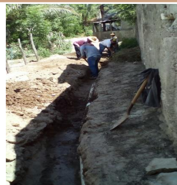
RAMAL NUEVO EN LA ALDEA ESPIRITU SANTO PARTE LADO BAJO DEL CEMENTERIO