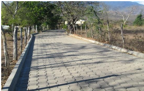
MEJORAMIENTO CALLE HACIA LA IGLESIA, ALDEA EL TAMBOR