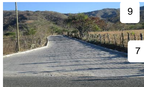
MEJORAMIENTO CALLE DE INGRESO, ALDEA LAS ANONAS