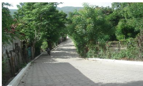
MEJORAMIENTO CALLE COLONIA 31 DE MAYO, CABECERA MUNICIPAL