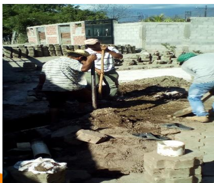
REPARACION DE TUBERIA EN ALDEA EL PASO DE LOS JALAPAS AGUA POTABLE