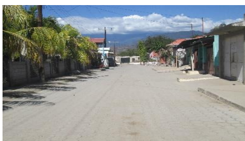
MEJORAMIENTO CALLE (S) COLONIA EL MITCH, ALDEA EL PASO DE LOS JALAPAS