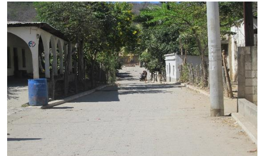
MEJORAMIENTO CALLE HACIA LA ESCUELA PRIMARIA, ALDEA ESPIRITU SANTO