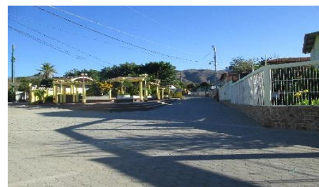
MEJORAMIENTO CALLE HACIA EL SALÓN COMUNAL, ALDEA SANTA ROSALÍA