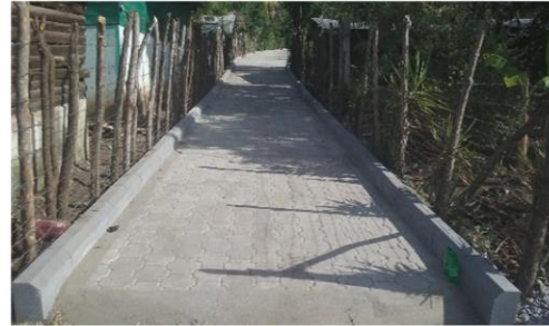
MEJORAMIENTO CALLE (S) COLONIA BELLA VISTA, ALDEA LAS OVEJAS