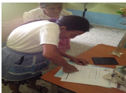
APOYO ECONÓMICO A PERSONAS DE ESCASOS RECURSOS POR EL SEÑOR ALCALDE MUNICIPAL