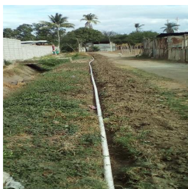
RAMAL DE AGUA POTABLE SECTOR LAS YARDAS