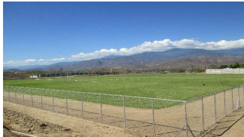
MEJORAMIENTO INSTALACIONES DEPORTIVAS Y RECREATIVAS (CAMPO DE FUTBOL) ALDEA EL PASO DE LOS JALAPAS