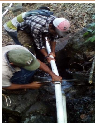
MEJORAMIENTO DE AGUA DE LA TUBERIA DE LA MONTAÑA