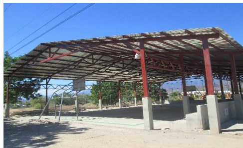
MEJORAMIENTO CANCHA POLIDEPORTIVA ALDEA EL PASO DE LOS JALAPAS