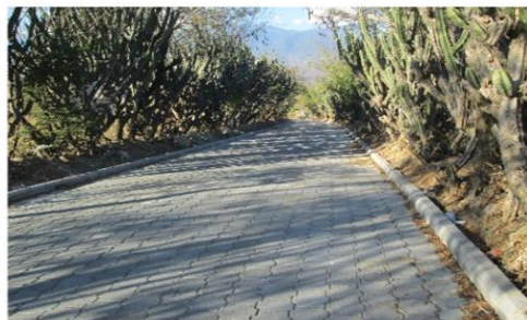
MEJORAMIENTO CALLE (S) ALDEA LO DE CHINA