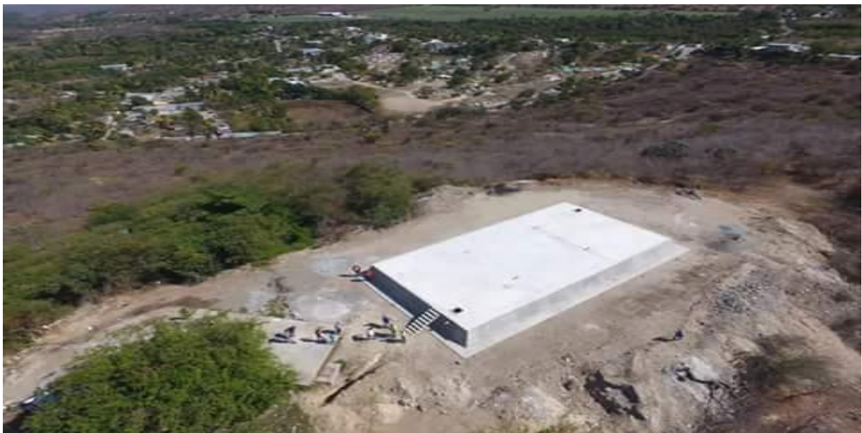
MEJORAMIENTO SISTEMA DE AGUA POTABLE CABECERA MUNICIPAL